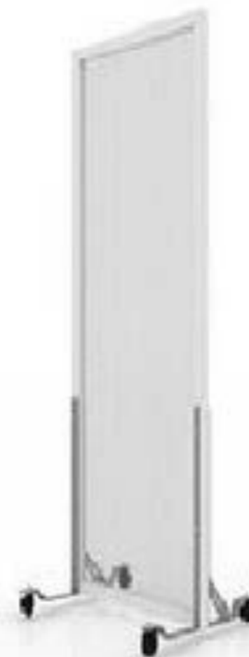
Separador de Ambiente Protector Policarbonato con Marco 200x210 cm

Plancha de policarbonato alveolar de 6 mm de espesor. Marco perimetral de de pvc blanco. Base autosoportante com ruedas y frenos. Color opal blanco, polishade gris y transparente, según disponibilidad. Medidas: Alto 200 cm Ancho 210 cm