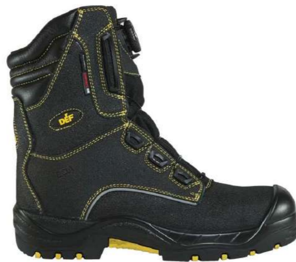
Zapato de seguridad Himalaya DF850 Defender

Código: 153511162785 Mercado Público: 1634461