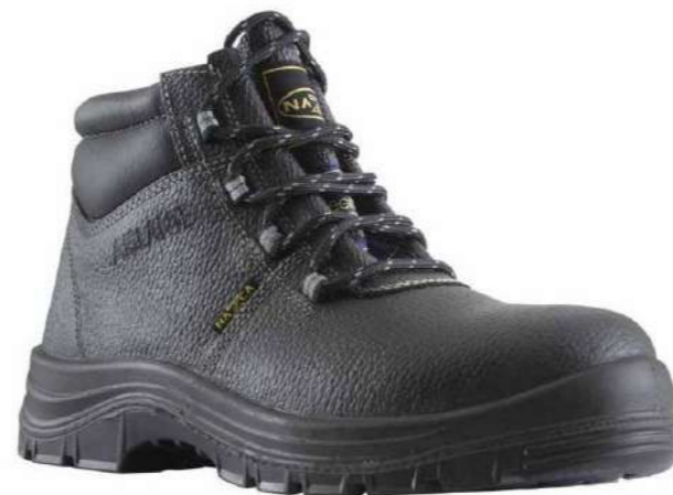
Zapato de seguridad New industrial Nazca

Código: 152622781152 Mercado Público: 1634706