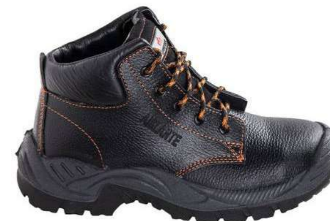
Zapato de seguridad 250 Quebec

Código: 201900960866 Mercado Público: 1634440