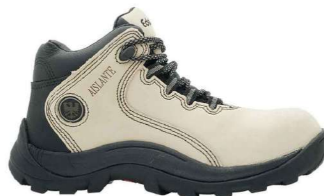
Zapato de seguridad ED-103 Edelbrock

Código: 152752190444 Mercado Público: 1634209