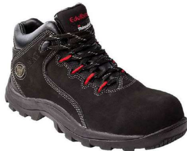
Zapato de seguridad ED-109 Edelbrock

Código: 153511162437 Mercado Público: 1634221