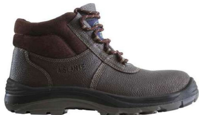
Zapato de seguridad Roble NU-308 Nazca

Código: 152622911424 Mercado Público: 1634866