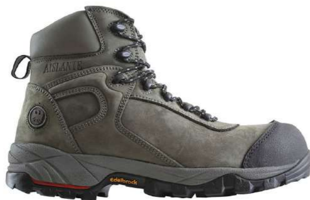
Zapato de seguridad ED-205 Edelbrock

Código: 15262284114 Mercado Público: 1635266