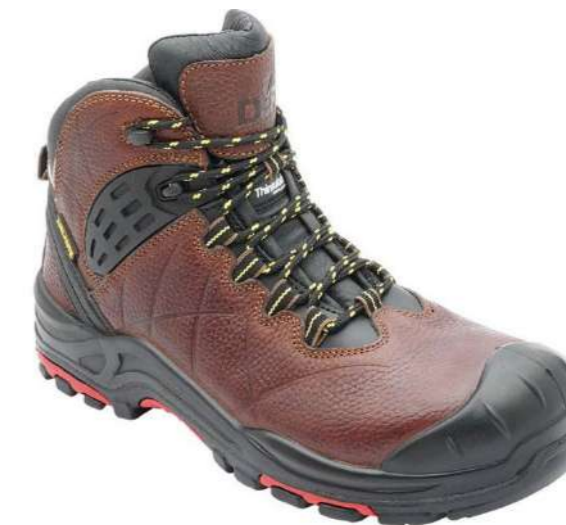
Zapato de seguridad Montego DF500 Defender

Código: 15351162812 Mercado Público: 1635187