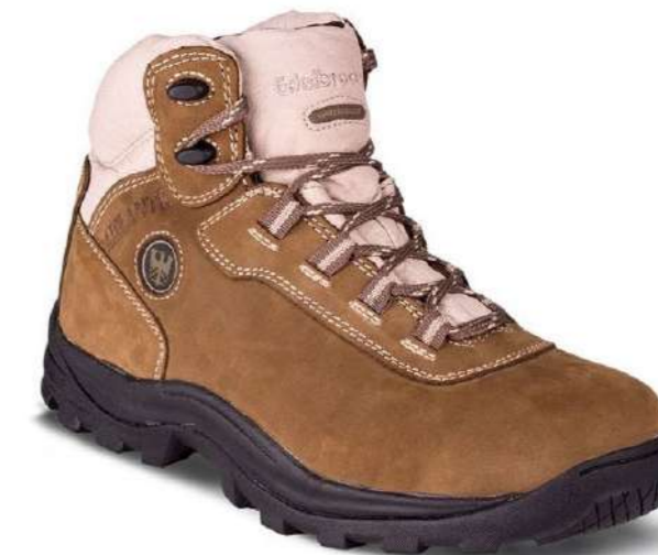
Zapato de seguridad ED-105 Edelbrock

Código: 152622370855 Mercado Público: 1635544